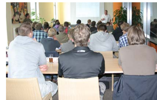
Regelkunde durch qualifizierte DEB-Referenten