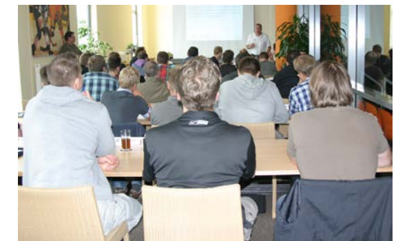
Regelkunde durch qualifizierte DEB-Referenten